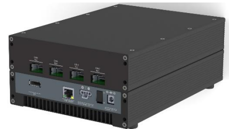
Abbildung 2: Standalone Variante – Rückseite