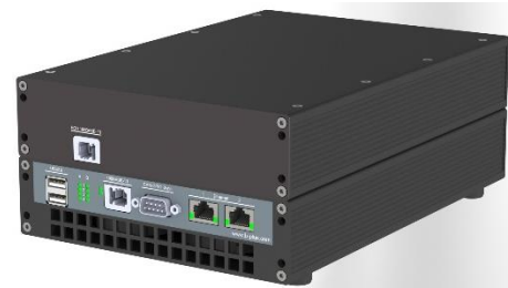
Abbildung 1: Standalone Variante – Vorderseite