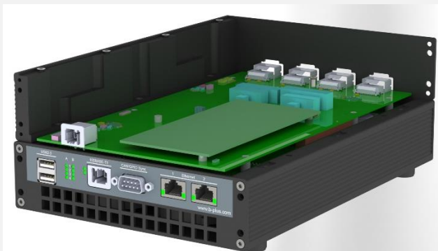
Abbildung 3: b-HiL mit offenem oberem Gehäuseteil